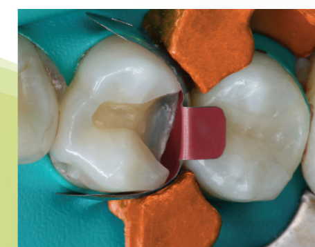
Preparation med Halo-systemet