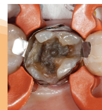
Preparation med Halo-systemet