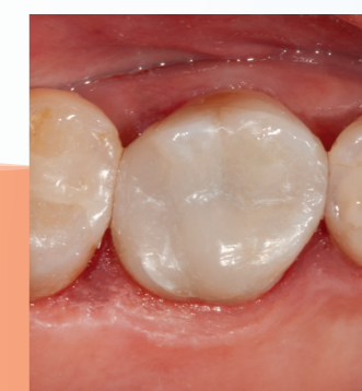
Efter behandling med Transcend komposit, Universal Body