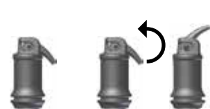
Abb. 2: Öffnen der Kapsel

Nach dem Mischen ist IonoStar Plus mindestens 1 min verarbeitbar (Raumtemperatur). Feuchtigkeitkontamination und Austrocknung vermeiden. Lässt sich das Arbeitsfeld nicht trocken halten, ist nach Ausarbeitung der Konturen/Modellieren ein Schutzlack zu applizieren (siehe entsprechende Gebrauchsinformation). Frühestens 3 min nach Mischende kann die Restauration z. B. mit Diamantschleifer, Polierer ausgearbeitet werden. Anschließend sollte erneut ein Schutzlack appliziert werden (siehe entsprechende Gebrauchsinformation).