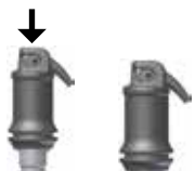
Εικ. 1: Ενεργοποίηση της κάψουλας εφαρμογής

Ανοίξτε προσεκτικά την έξοδο υφίζοντα με τη ρύγχος της κάψουλας μέχρι να καταλάβετε πως σταμάτησε (βλ. εικ. 2) και εφαρμόστε το υλικό κατευθείαν μέσα στην κοιλότητα μέσα σε 10 δευτέρα από το τέλος της ανάμιξης , πιέζοντας τις χειρολαβές του εργαλείου εφαρμογής αργά και ομαλά. Το ρύγχος μπορεί να προσαρμοστεί κατά απαίτηση, περιστρέφοντας ολόκληρη την κάψουλα εφαρμογής μέσα στον βραχίονα συγκράτησης του εργαλείου εφαρμογής. Ο χρόνος εργασίας και η σύσταση μπορεί να επηρεαστούν από το αντίστοιχο τύπο συσκευής ανάμιξης και από τον χρόνο ανάμιξης.