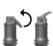
Εικ. 2: Άνοιγμα της κάψουλας