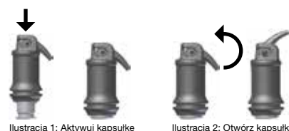
Ilustracja 1: Aktywuj kapsułę

Ostrożnie otworzyć ujście poprzez podnoszenie cannuli, dopóki nie poczujecie się oporu (patrz: Ilustracja 2), i zaaplikować materiał bezpośrednio na ubytek w ciągu 10 sekund od końca mieszania , przez dociskanie dźwigni na aplikatorze równomiernie i powoli. Canulla może być pokierowana w zależności od ugodobna poprzez przekręcenie calek kapsuły aplikacyjnej do środka pojemnika. Czas pracy i konsystencja mogą być zmienione w zależności od typu kapsuły miksującej oraz czasu mieszania.