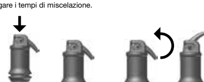
Ill. 1: Attivare la capsula

Aprire la capsula tirando su la cannula finché si senta una piccola resistenza (vedere ill. 2) e applicare il materiale al più tardi 10 s dopo la miscelazione direttamente nella cavità premendo leggermente e omogeneamente la leva dell'applicatore. Ruotando la capsula nel dispositivo della pinza, si può variare l'allineamento della cannula. Il tempo di lavoro e la consistenza dipendono dal tipo di miscelatori per capsule e possono abbreviare o allungare i tempi di miscelazione.