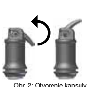
Obr. 2: Otvorenie kapsuly

Po premiešaní je IonoStar Plus (pri izbovej teplote) spracovateľný najmenej 1 min. Zabráňte kontaminácii vlhkosťou a vysušeniu. Ak nie je možné pracovné pole udržať suché, vo vypracovaní kontúr/vymodelovaní aplikujte ochranný lak (pozri príslušný návod na použitie). Najskor 3 min. po ukončení miešania môžete rekonštrukciu opracovať napr. diamantovou brúskou, príp. leštičom. Potom znovu aplikujte ochranný lak (pozri príslušný návod na použitie).