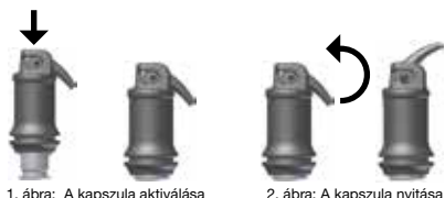
1. ábra: A kapszula aktiválása

Óvatosan nyissa ki az applikációs cső megemelésével a kapszulát, egészen addig, amíg úgy érzi, hogy megakad (lásd a 2. ábrát.) és applikálja az anyagot közvetlenül a kavitásba a keverés végétől számított 10 másodpercen belül az applikátor karjának lassú és egyenletes összenyomásával. A kanült a kívánt irányba az egész applikációs kapszula elforgatásával lehet beállítani. A munkaidő és a konzisztencia függ az adott kapszulakeverő gép típusától és a keresési időtől.