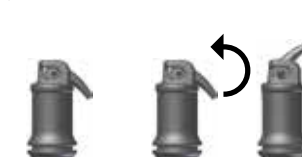
Ill. 2 : Ouverture de la capsule

Après le mélange, IonoStar Plus peut être mis en œuvre pendant au moins 1 min (à température ambiante). Éviter toute contamination par une substance humide ainsi que tout dessèchement. Si le site ne peut être maintenu à l'état sec, il convient d'appliquer un vernis protecteur après le dégrossissage des contours/le modelage (voir le mode d'emploi correspondant). La restauration peut être finie au plus tôt 3 minutes après la fin du mélange, par exemple à l'aide d'une fraise diamantée ou d'un polissoir. Ensuite, appliquer à nouveau un vernis protecteur (voir le mode d'emploi correspondant).