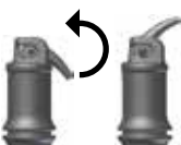
Obr. 2: Otevření kapsle

Po namíchání jde IonoStar Plus zpracovávat nejméně 1 minutu (při pokojové teplotě). Zabraňte kontaminaci materiálu vlhkostí i jeho zaschnutí. Pokud není možné zachovat suché pracovní pole, je třeba po ukončení modelace nanést na výplň ochranný lak (viz příslušný návod k použití). Výplň je možné dokončovat, např. diamantovým bruskem nebo leštítkem, nejdříve 3 minuty od ukončení míchání. Poté se opět může nanést ochranný lak (viz příslušný návod k použití).