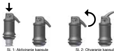
Sl. 1: Aktiviranje kapsule

Podizanjem kanile dok ne osjetite graničnik otvorite otvor za ispuštanje (vidi sl. 2) i materijal aplicirati najkasnije 10 s po završetku miješanja laganim, ravnomjermim pritiskanjem poluge aplikatora izravno u kavitet. Okretanjem cijele aplikacijske kapsule u držaču može centrirati kanilu po želji. Svaki tip mješalca za kapsulu i vrijeme miješanja utječu na vrijeme obrade i konzistentnost.