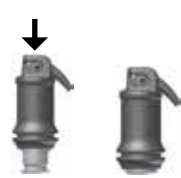
Billede 1: Aktivering af kapslen

Åbn forsigtigt udgangen ved at løfte kanylespidsen indtil du mærker et stop (se fig 2). Applicer materialet direkte i kaviteten indenfor 10 sekunder efter blanding, ved at presse aplikatørens håndtag langsomt og jævnt. Kanylen kan vinkles efter ønske ved at dreje hele kapslen i holderen. Arbejdstid og konsistens kan påvirkes ved forskellige typer mixere og blandetider.