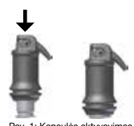
Pav. 1: Kapsulės aktyvavimas

Atsargiai atidarykite aplikavimo angą pakeldami kaniulę, kol pajusite sustojimą (žiūrėkite pav. 2), ir aplikukite medžiagą tiesiogiai į ertmę per 10 s nuo sumaišymo pabaigos , spausdami aplikatoriaus svertį lėtai ir tolygiai. Kaniulės padėtis gali būti pakeista reikaliu esant sukant visą kapsulę laikliu viduje. Darbo laikas ir konsistencija gali priklausyti nuo kapsulių maišytuvo tipo ir maišymo laiko.