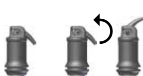
Fig. 2: Deschiderea capsulei

După amestec, IonoStar Plus poate fi manevrat pentru cel puțin 1 minut (la temperatura camerei). Preveniți contaminarea cu umezeală a materialului și uscarea acestuia. Dacă nu este posibil să mențineți un câmp de lucru uscat, ar trebui aplicat un lac protector după ce ați terminat manoperile de conturare/modelare (vezi instrucțiunile de utilizare specifice). Restaurarea poate fi finisată, de ex. cu o freză diamantată sau un polipant, cel mai devreme după 3 minute de la terminarea procesului de mixare. Ar trebui aplicat din nou un lac protector (vezi instrucțiunile de utilizare specifice).