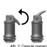
Afb. 2: Capsule openen

Na het mengen kan IonoStar Plus minstens 1 minuut lang worden verwerkt (kamertemperatuur). Vermijd contaminatie door vocht en uitdroging. Als het werkveld niet droog kan worden gehouden, dan moet na het uitwerken van de contouren/het modelleren een bescherm lak worden aangebracht (zie dienovereenkomstige gebruiksinformatie). Op zijn vroegst 3 minuten na mingeinde kan de restauratie bijv. met diamantslijpstift, polijstapparaat worden bewerkt. Daarna moet opnieuw een bescherm lak worden aangebracht (zie dienovereenkomstige gebruiksinformatie).