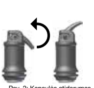
Pav. 2: Kapsulės atidarymas

Po sumaišymo, su IonoStar Plus gali būti dirbama mažiausiai 1 min (kambario temperatūroje). Apsaugokite medžiagą nuo užteršimo drėgme ir nuo išdžiuvimo. Jei negalima palaikyti sauso darbinio lauko, naudokite apsauginį laką po kontūravimo/modeliavimo (vžiūrėkite atitinkamas naudojimo instrukcijas). Restauracija gali būti pabaigta, pvz., deimantiniu grąžtu ar poliru akščiausiai po 3 min nuo maišymo pabaigos. Vėl aplikukite apsauginį laką (žiūrėkite atitinkamas naudojimo instrukcijas).