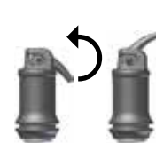
Fig. 2: Öppning av kapseln

Efter blanding kan IonoStar Plus bearbetas i minst 1 minut (vid rumstemperatur). Undvik att materialet kontamineras med fuktighet eller att det torkas ut. Om det inte är möjligt att hålla arbetsområdet tørt, ska en skyddande varnish appliceras efter avslutad modellering och konturering (se tillhörande bruksanvisning). Restaurationen kan finishas, t.ex. med putsdiamant eller polerare, tidigast 3 minuter efter blandningens slut. Ett skyddande lager varnish ska därefter åter appliceras (se tillhörande bruksanvisning).