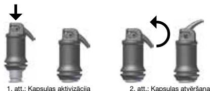
1. att.: Kapsulas aktivizācija

Pacelot kanili uz augšu līdz jutamai atdurei, atbrīvojiet atveri (skat. 2. att.) un ne vēlāk kā 10 sek. pēc maisīšanas beigām aplicējiet materiālu tieši dobumā, lēnām un vienmērīgi spiežot klāt aplikatora sviru. Turētājā pagriežot visu aplikācijas kapsulu, kanili iespējams novietot jebkurā pozīcijā. Iz mantotā kapsulu maisītāja tips un maisīšanas ilgums var ietekmēt apstrādes laiku un materiāla konsistenci.