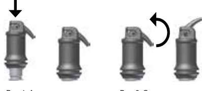
Рис. 1: Активация капсулы

Носик канюли требуется открыть (поднять) до ощущаемого щелчка (см. рис. 2) и путем медленного, равномерного надавливания на рычаг аппликатора апплицировать материал прямо в полость не позднее чем через 10 сек. после окончания смешивания . Поворачивая аппликационную капсулу в держателе, канюлю можно разместить в любом желаемом направлении. На время работы и консистенцию можно оказать влияние путем использования определенного типа смесителя и меняя время смешивания.