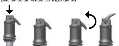
Fig. 1: Ativação da cápsula

Levantar cuidadosamente a cânula até o fim, para destapar a abertura da cápsula (ver fig. 2) e aplicar o material, no máximo 10 s após o fim da mistura , diretamente na cavidade, pressionando lenta e uniformemente a alavanca do aplicador. A cânula pode ser ajustada da forma desejada, rodando a cápsula de aplicação inteira no suporte. O tempo de trabalho e a consistência podem ser influenciados pelo tipo de misturador de cápsulas e pelo tempo de mistura correspondentes.