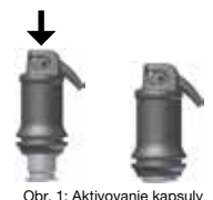
Obr. 1: Aktivovanie kapsuly

Vypúšťací otvor otvoríte nadvihnutím kanyly až po citeľný doraz (pozri obr. 2) a materiál do 10 sekúnd od ukončenia miešania aplikujte pomaly, rovnomerným stláčaním páčky aplikátora priamo do kavity. Otáčaním celej aplikáčnej kapsuly v upínadle možno kanylu nasmerovať ľubovoľným smerom. Doba opracovateľnosti a konzistencia môžu byť ovplyvnené v závislosti od typu miešača a doby miešania.