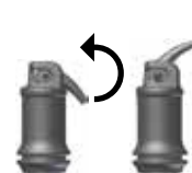
Kuva 2: Kapselin avaaminen

Sekoittamisen jälkeen, IonoStar Plusia voidaan työstää ainakin 1 minuutin ajan (huoneenlämmössä).