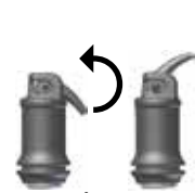
Billede 2: Åbning af kapslen

Efter blanding, kan IonoStar Plus bearbejdes i mindst 1 min (ved rumtemperatur). Undgå at materialet kontamineres med fugt, eller tørrer ud. Hvis det ikke er muligt at skabe et tørt arbejdsmiljø, bør der anvendes en beskyttende lak efter opbygning og modellering er færdiggjort (følg den respektive brugsanvisning). Restaureringen kan færdiggøres med et diamantbor eller poler, tidligst 3 minutter efter afslutning af blandetiden. En beskyttende lak bør anvendes igen (følg den respektive brugsanvisning).