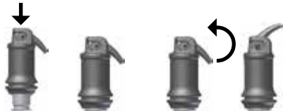
Fig. 1: Activating the capsule

Carefully open the outlet by lifting the cannula until you feel a stop (see fig. 2), and apply the material directly into the cavity within 10 s of the end of mixing by compressing the lever on the applicator slowly and evenly. The cannula can be aligned as required by turning the whole application capsule inside the holder. Working time and consistency may be influenced by the respective type of capsule mixer and mixing time.