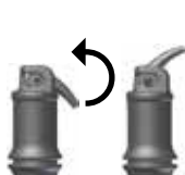
Fig. 2: Åpning av kapselen

Etter blanding kan IonoStar Plus bearbeides i minst 1 minutt (i romtemperatur). Beskytt materialet fra kontaminering av fuktighet og mot uttørring. Dersom det ikke er mulig å holde arbeidsområdet tørt skal en beskyttende varnish appliseres etter fullføring av modelleringen (se vedlagte bruksanvisning). Restaureringen kan fullføres f.eks med et diamantbor eller en polerer, tidligst 3 minutter etter at mixingen er fullført. En beskyttende varnish skal deretter nok en gang appliseres (se vedlagte bruksanvisning).