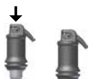
Fig. 1: Aktivtering av kapselen

Åpne kapselen forsiktig ved å løfte kanylen inntil du kjenner et stopp (se fig. 2). Appliser materialet direkte i kaviteten innen 10 sekunder etter slutten på mixingen ved å trykke applikatorens håndtak sakte og helt inn. Kanylen kan snus i ønsket retning ved å snu hele applikasjonskapselen inne i holderen. Arbeidstiden og konsistensen kan influeres ved de forskjellige typer mixer og blandetid.